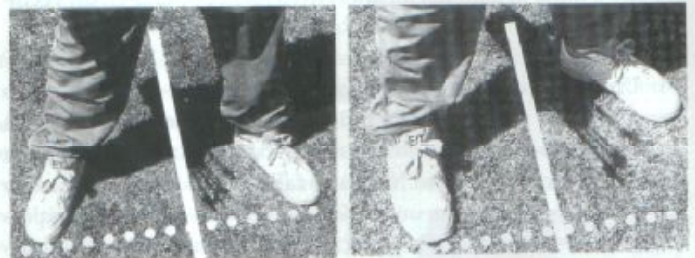
Dibujo 1 Postura de pies perpendicular / postura abierta

Los nueve pasos son estos: La postura, situar la flecha, la preparación, la pretensión, la apertura o tensión del arco, el anclaje, la